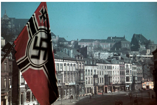
« Liège sous l'Occupation ».

Ce contexte explique pourquoi Les 7 Boules de Cristal est une aventure remplie de mystère et de suspense, loin des conflits de l'époque. 📖 ✨