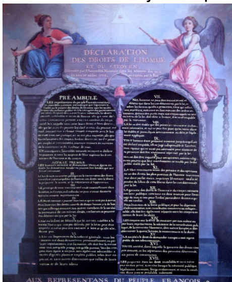
Déclaration des droits de l'homme et du citoyen

Ecrire les dates des documents ci-dessus.