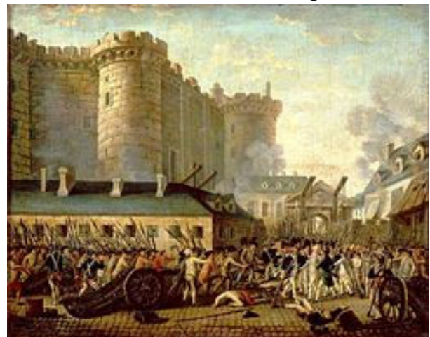
Prise de la Bastille