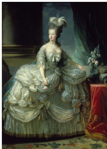
Louis XVI et Marie Antoinette