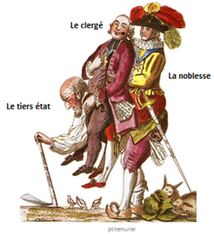
Les trois ordres (caricature)