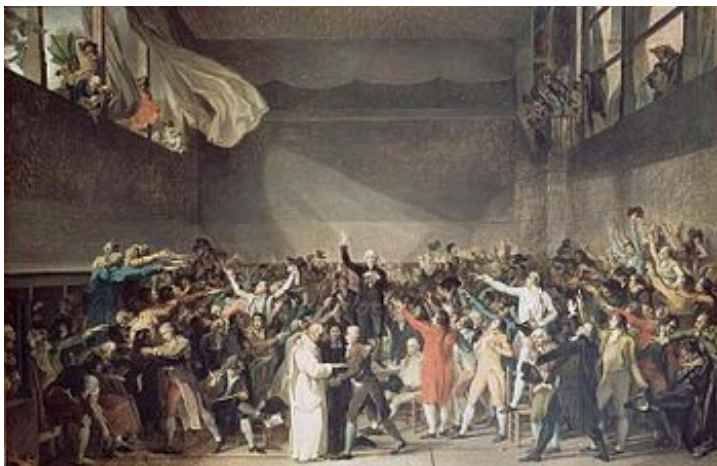
Serment du jeu de paume