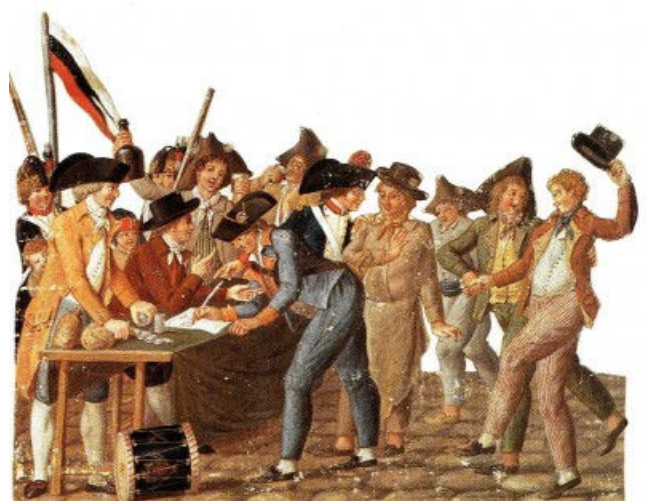
Enrôlement des volontaires 1792