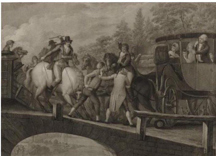
Fuite du roi et arrestation à Varennes