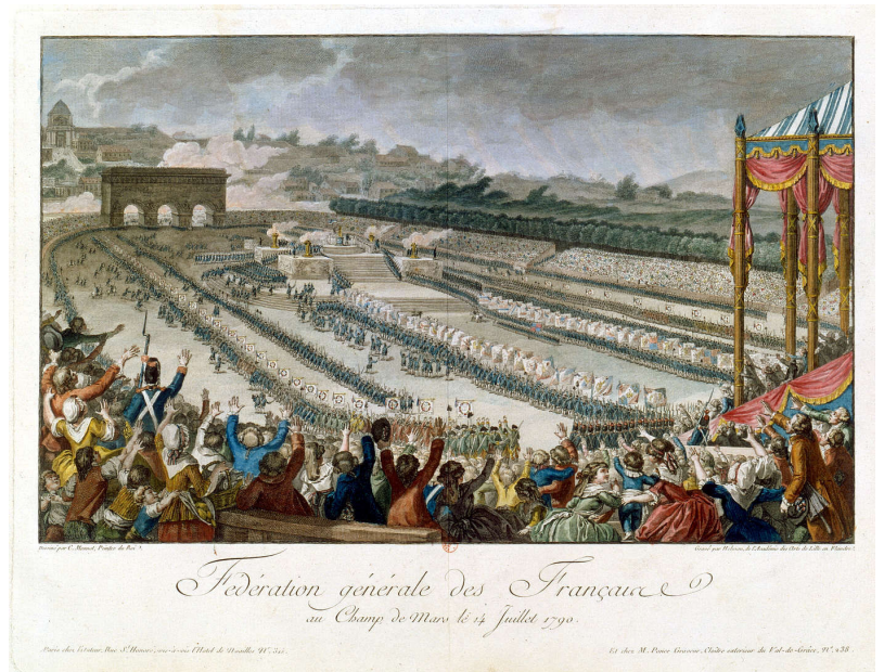
14 juillet 1790, fête de la fédération