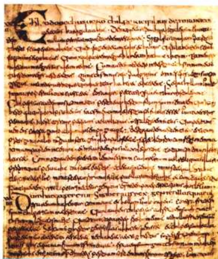
Doc. 2 Grégoire de Tours, Histoires , copie du VII e siècle, manuscrit mérovingien

Mise à jour lors des fouilles archéologiques menées à Saint-Dizier (Haute-Marne), 2002.