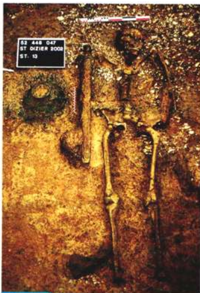
Doc. 1 Tombe mérovingienne, VI e siècle

Observe attentivement tous les documents