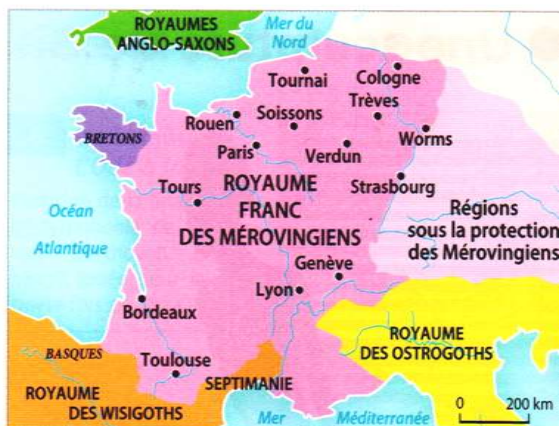
Doc. 6 Carte de l'implantation des Mérovingiens au VI e siècle

Bâtiment mis à jour à Pratz. Restitution proposée par les archéologues.