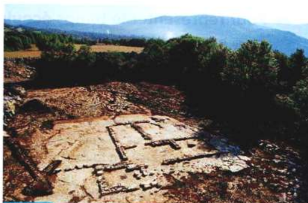
Doc. 4 Restes d'un bâtiment résidentiel de l'époque mérovingienne, VII e siècle

Retrouvée dans la nécropole de Sainte-Fontaine. MUDO. Musée de l'Oise, Beauvais.