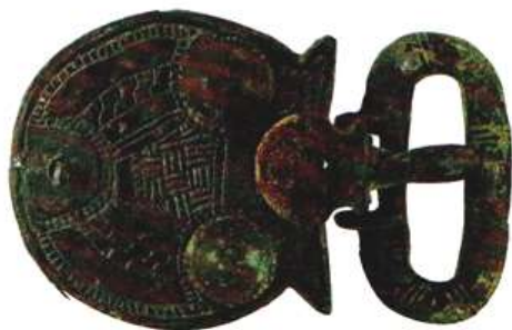
Doc. 3 Boucle de ceinture, V e siècle

Retrouvée dans la nécropole de Sainte-Fontaine. MUDO. Musée de l'Oise, Beauvais.