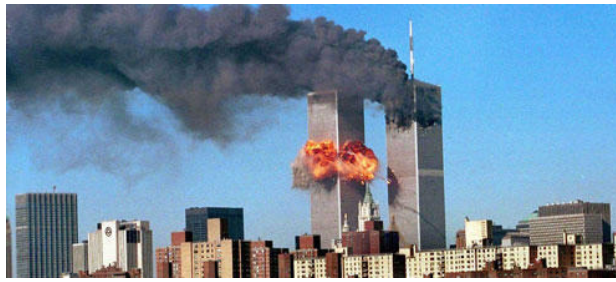
Attentat du 11 septembre à New York